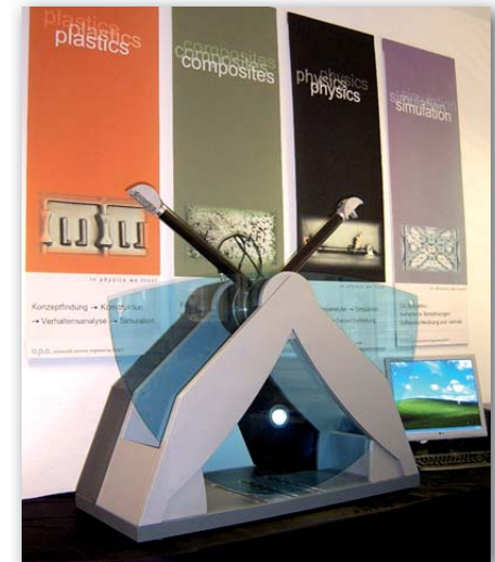
Pendelprüfsystem 4a impetus